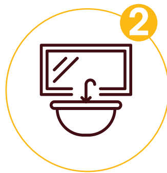
Armaturen und sanitäre Einrichtungen