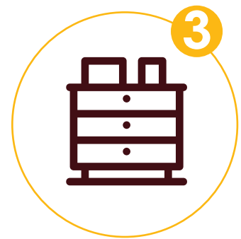
Tablare und Tische