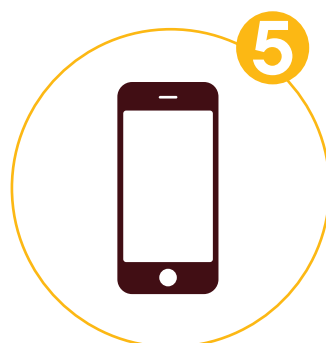
Festnetz und Mobiltelefone